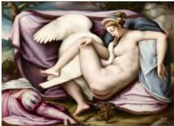
BACCIACCA LEDA E IL CIGNO

Uno zoo artistico con oltre 80 opere che raccontano le storie — sacre e mitologiche — di Diana cacciatrice con il suo cane, Leda e il cigno, ma anche i «battibecchi» tra animali da cortile e le leggende sui magici unicorni. Tra i lavori di Guercino, Bacciacca e Grechetto, anche 4 capolavori del Pitocchetto, mai esposti prima, come la coppia di tele raffiguranti il Vecchio con carlino e il Vecchio con gatto.