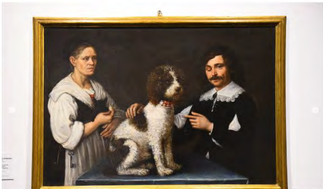
SPETTACOLI BRESCIA PALAZZO MARTINENGO CONFERENZA STAMPA INAUGURAZIONE MOSTRA GLI ANIMALI NELL'ARTE NELLA FOTO SALE MOSTRA 18/01/2019 NEW REPORTER FAVRETTO