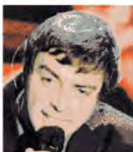
THE NIRO Il cantautore al Macro alle ore 21, 22 e alle 22.30