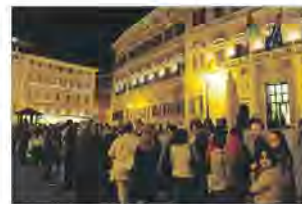
Notte dei musei in musica il successo dell'iniziativa

tre 250 foto degli spettacoli in tutti gli spazi. Le pagine del sito www.museiincomuneroma.it hanno ottenuto 16.500 visite, il triplo rispetto allo scorso anno e l'account Twitter @museiincomune ha raggiunto i 75mila profili.