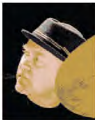
GATTO In trio all'Ara Pacis per tre esibizioni alle 21, 22.30 e 24