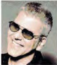
ZARRILLO Ai musei Capitolini doppio concerto alle 21.30 e alle 23