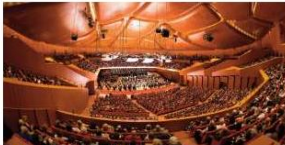
ACCADEMIA SANTA CECILIA ROMA