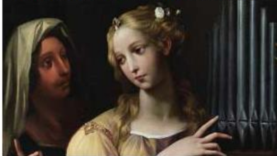
SANTA CECILIA GIUSEPPE CESARI, DETTO IL CAVALIER D'ARPINO

La Fondazione Sorgente Group celebra così anche la Santa patrona della musica, a cui è stata intitolata anche la più antica Accademia di musica a Roma, che tanto impulso è riuscita a dare alla ripresa dei concerti dopo la riapertura il 26 aprile con il concerto riservato ai volontari della Croce Rossa, i concerti di primavera e i prossimi concerti d'estate presso la Cavea dell'Auditorium Parco della Musica Ennio Morricone.