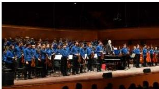
LA JUNIORORCHESTRA DELL ACCADEMIA NAZIONALE DI SANTA CECILIA (1)