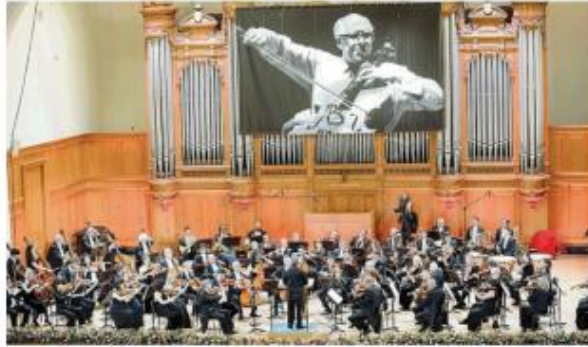
ORCHESTRA ACCADEMIA SANTA CECILIA