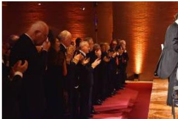
APPLAUSI PER ANTONIO PAPPANO E I SOLISTI DELL ACCADEMIA DI SANTA CECILIA