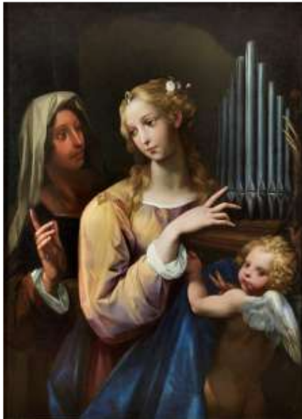
SANTA CECILIA GIUSEPPE CESARI, DETTO IL CAVALIER D'ARPINO

Infatti, in occasione dell'esposizione del dipinto Santa Cecilia, concesso in prestito a Pisa presso il Palazzo dell'Opera per la mostra "Orazio Riminaldi. Un maestro pisano tra Caravaggio e Gentileschi", la Fondazione ha voluto rendere omaggio al celebre pittore. Nel racconto di Strinati il Cavalier d'Arpino ritrae la Santa, la vergine fanciulla devota a Dio che si converte al cristianesimo, come incarnazione della dolcezza femminile, dell'estasi e della giovinezza, virtù che si sublimano in spiritualità superiore.