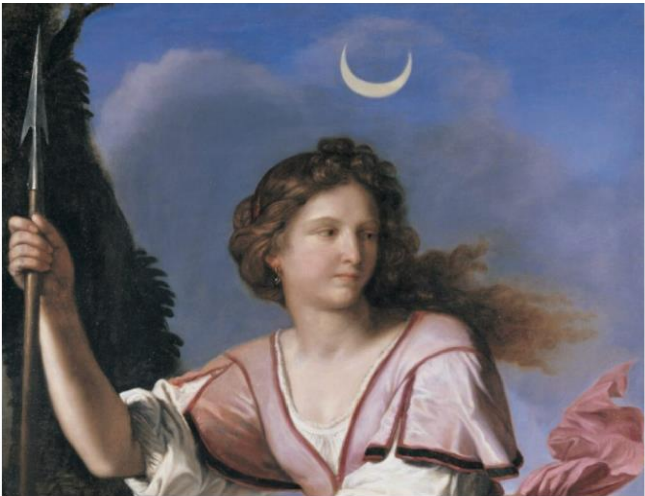
Diana Cacciatrice (Il Guercino)

Da oggi è disponibile online la quinta puntata della serie "Dieci capolavori della Fondazione Sorgente Group in cinque secoli" curati dal critico d'arte Claudio Strinati, che illustra la celebre tela di Giovanni Francesco Barbieri, detto il Guercino