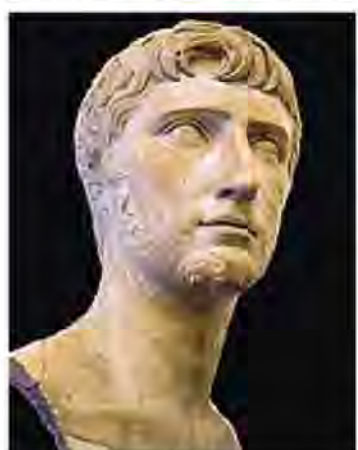
La testa In marmo, alta 46 centimetri, risale al I secolo d. C. e proviene dalla Fondazione Sorgente Group, che l'ha acquistata alla fine di ottobre a un'asta londinese

Eugenio La Rocca Ha confermato l'identificazione delle sembianze con Gaio principe designato