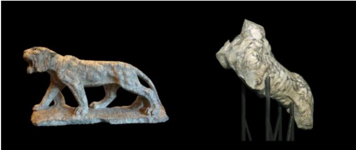
A sx Tigre incedente e a dx Tigre rampante -Fondazione Sorgente Group

saranno parte integrante della Mostra che svelerà al grande pubblico la figura del gladiatore e l'affascinante storia di uomini coraggiosi che, grazie alle loro imprese nel circo, conquistarono una posizione nella società romana. E proprio le fiere, sempre presenti nei combattimenti dei gladiatori, aggiungevano maggior enfasi e drammaticità allo spettacolo. Questi combattenti dell'arena, celati dai loro temibili elmi, incarnavano importanti virtù romane, come testimoniano le opere di Cicerone e Seneca : coraggio, forza e disprezzo della morte, virtus con cui i romani costruirono il loro potere a Roma e nelle Province