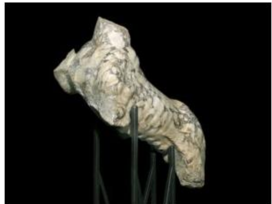
Tigre in marmo pavonazzetto Fondazione Sorgente Group