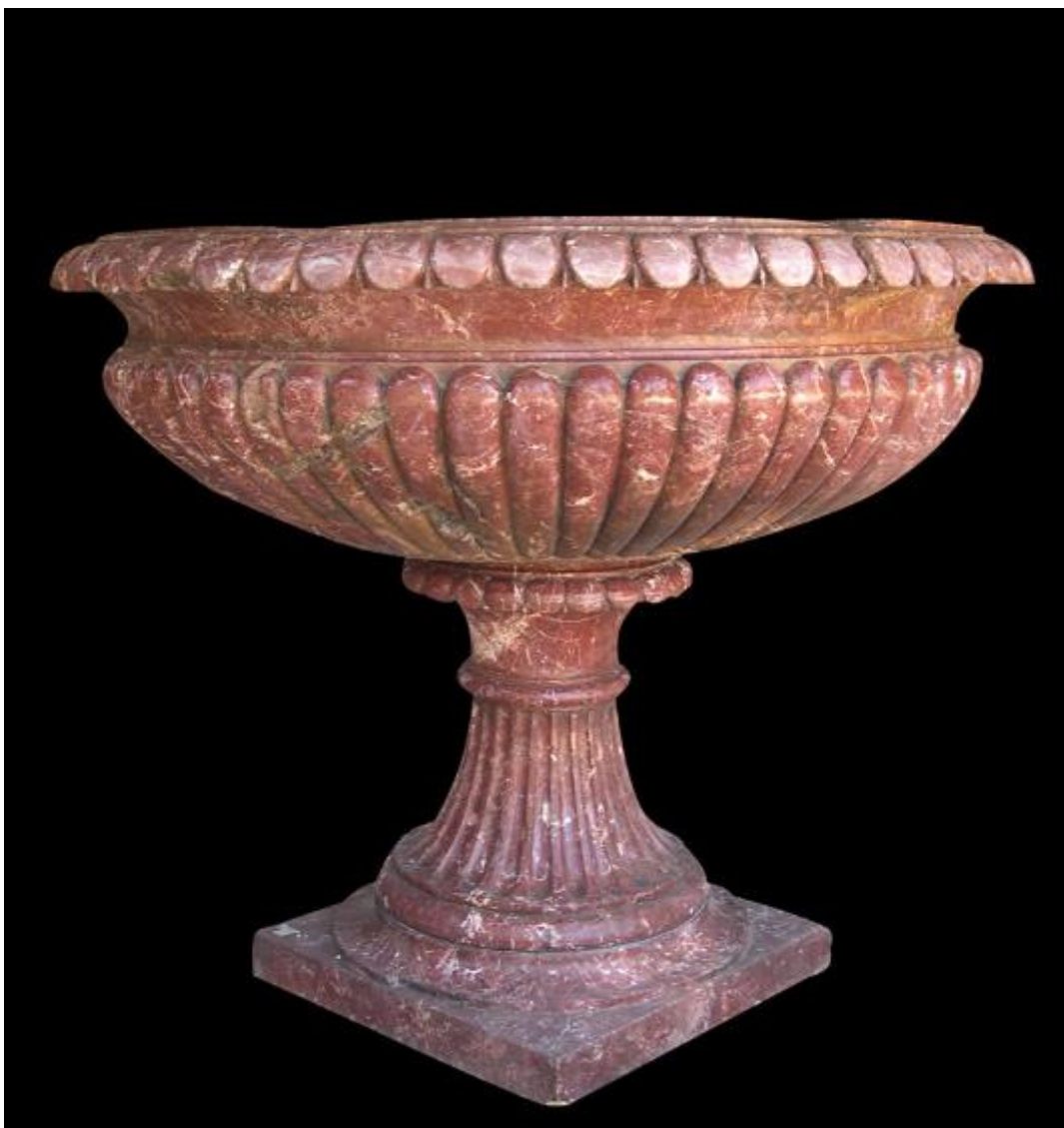
“Labrum” in marmo cottanello antico, Età imperiale (II-III d.C.) con rilavorazione della base nel XVI secolo, alt. cm 134,8, diametro cm 165,5 (Roma, Collezione M.)

segue: www.lagazzettadellantiquariato.it