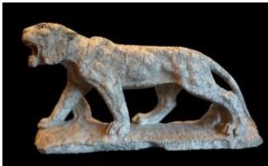
Tigre, cipollino mandolato. Fondazione-Sorgente Group

Le Tigri della Fondazione Sorgente Group esposte nella Mostra di Basilea " Gladiatore. La vera storia "