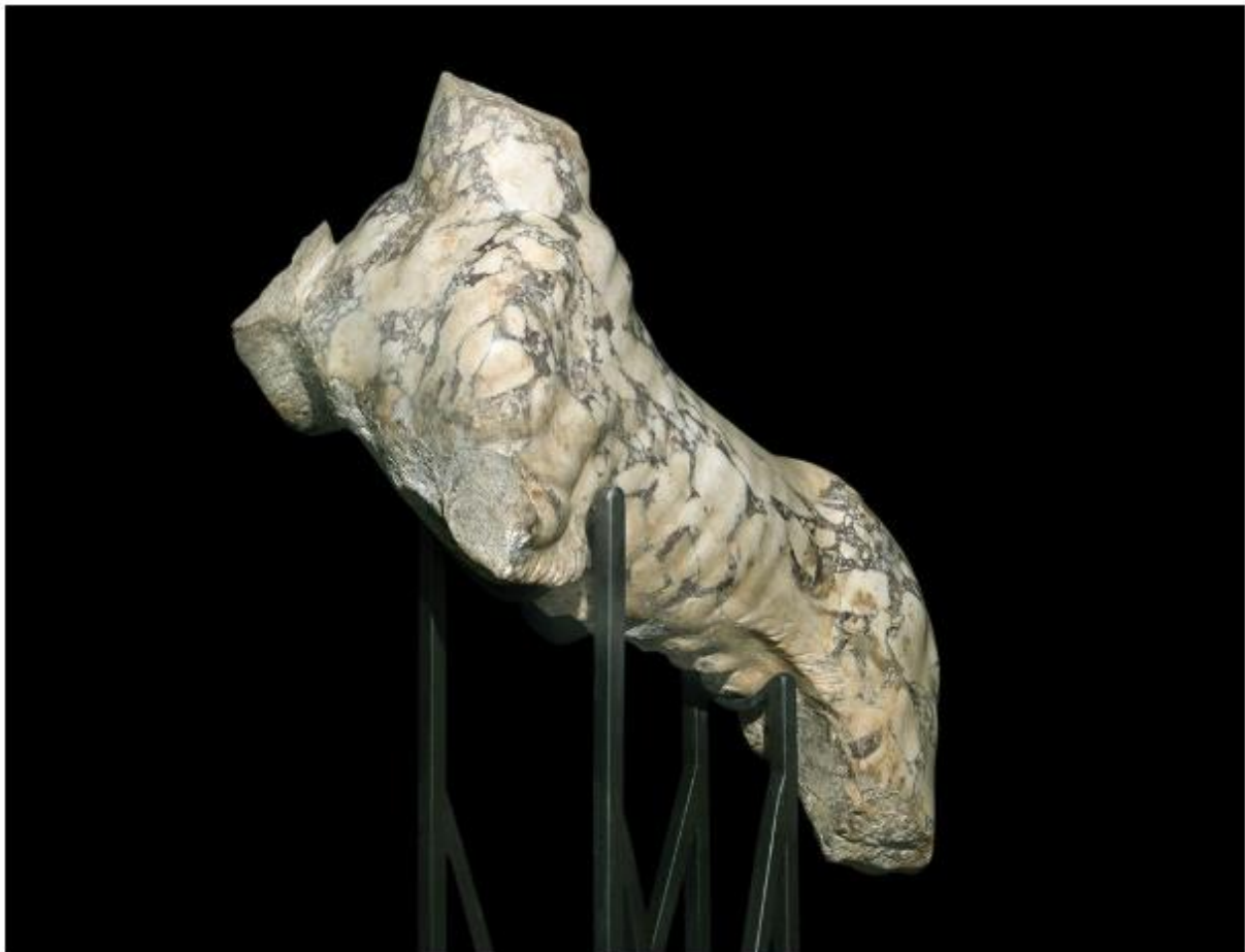
"Tigre rampante", marmo pavonazzetto (marmor Phrygium), II d.C., alt. cm 44, lungh. max. cm 73,5, largh. cm 35

(Roma, Collezione Fondazione Sorgente Group)