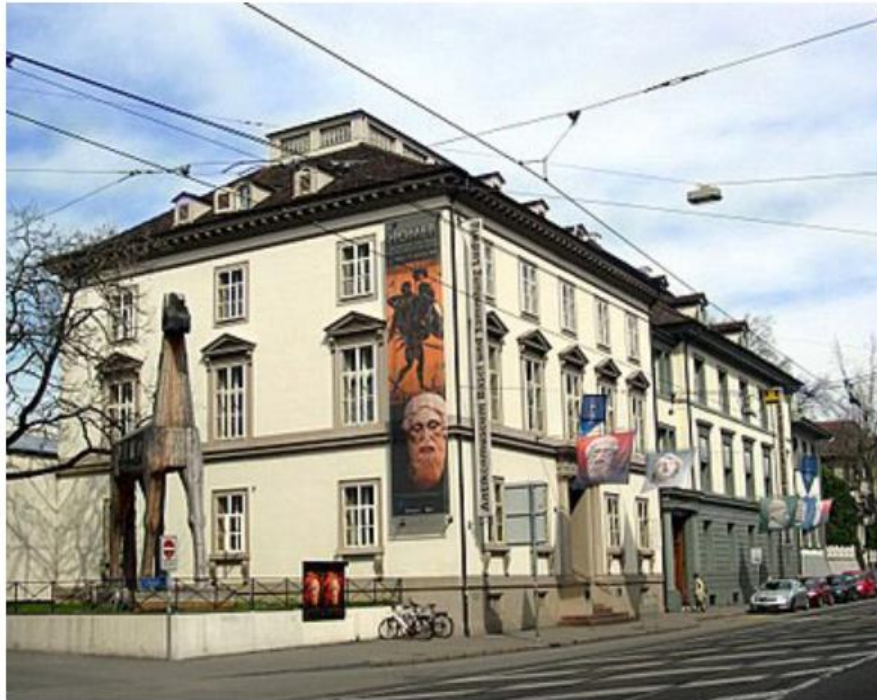
Il Museo delle Antichità Basilea e Collezione Sammlung Ludwig

segue: www.lagazzettadellantiquariato.it