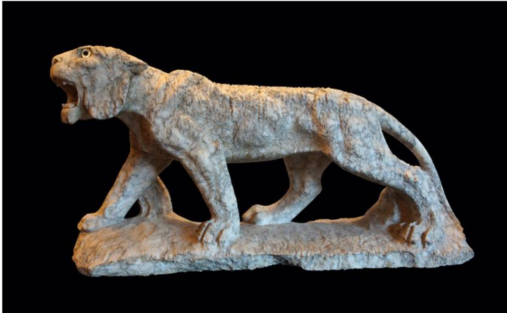
"Tigre incedente", marmo bianco con venature verdastre (cipollino mandolato. ), fine I-II d.C., alt. cm 43,5 x cm 78, largh. cm 21 (Roma, Collezione Fondazione Sorgente Group)

Accreditati in ragione della loro qualità e rarità, i pezzi presi in prestito dai privati, se da un lato affermano la loro valenza storico artistica ai fini della completezza didattica espositiva dei temi affrontati, dall'altro confermano la necessità, da parte dei musei pubblici, di usufruire del sostegno esterno in termini di finanziamento e di presenza di opere al fine di mettere a punto manifestazioni di qualità.