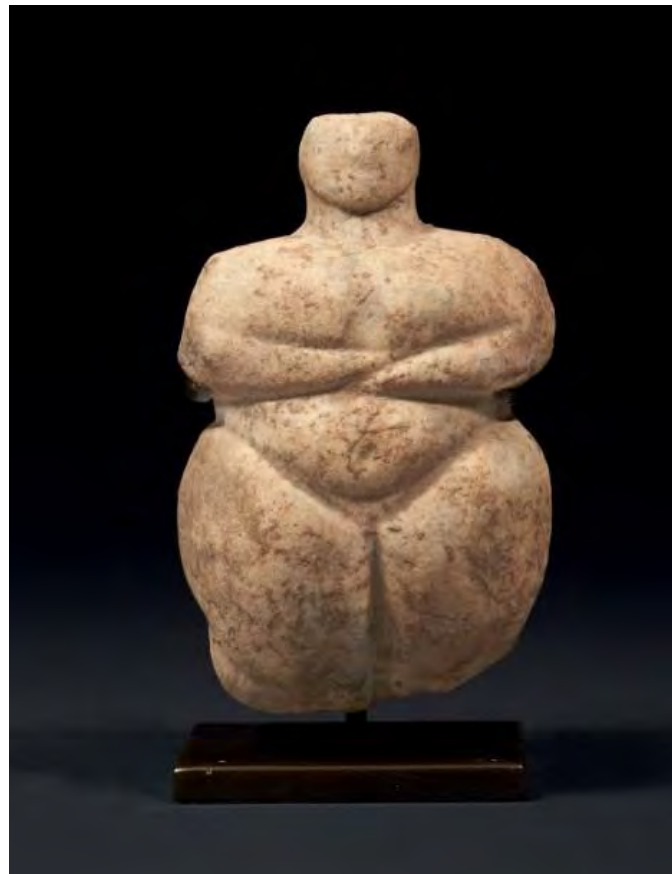
Grande Dea Madre - Collezione Mainetti