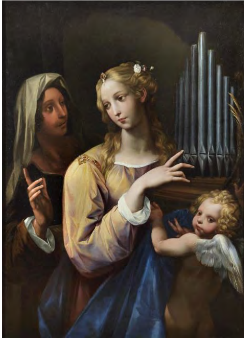
Roma, 10 mag 11:35 - (Agenzia Nova) - Cavalier d'Arpino Santa Cecilia (Rer)

Cultura: Sorgente group, alla mostra "Eva vs Eva" a Tivoli con il Guercino e altre due opere di pittura e archeologia - foto 1