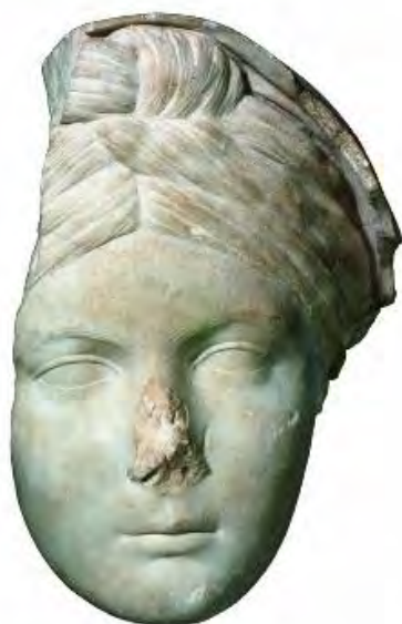
Ritratto femminile velato raffigurante Vibia Sabina, età adrianea

Di Il Giornale delle Mostre (by Il Giornale dell'Arte) - Maggio 2019