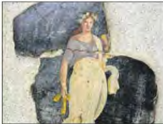
Frammento di affresco con figura femminile coronata d'edera dalle Terme Suburbane di Pompei (1 sec. d.C.)

Rinascimento, mentre l'Italia insegnava la cultura all'Europa, ma era occupata da potenze straniere, gli storici le confezionarono un'etichetta satanica e orripilante. Sannazzaro la definì «figlia, moglie e nuora del pontefice».