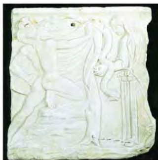
Le sculture Il bassorilievo con Giasone e Medea tra un pendente in avorio (a sinistra) e Agrippina