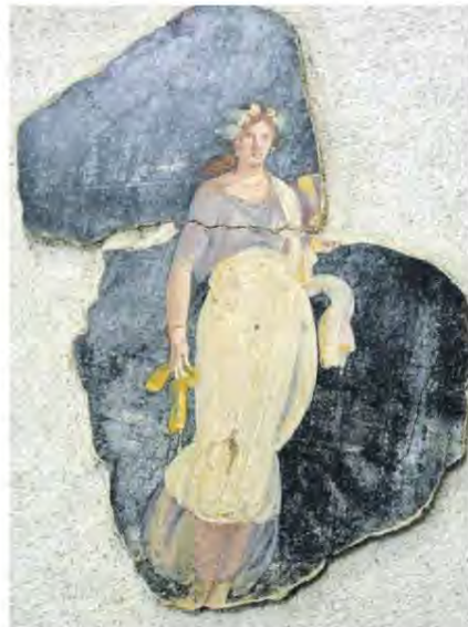
Un affresco staccato che sarà esposto nella mostra di Tivoli. Accanto alle opere d'arte romana anche dipinti del Settecento (Piazzetta) e del XXI secolo

Da maggio a villa d'Este e al Tempio di Ercole opere d'arte antiche e moderne in "Eva vs Eva"