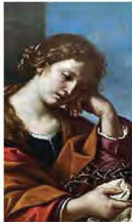
Guercino Maddalena (particolare)