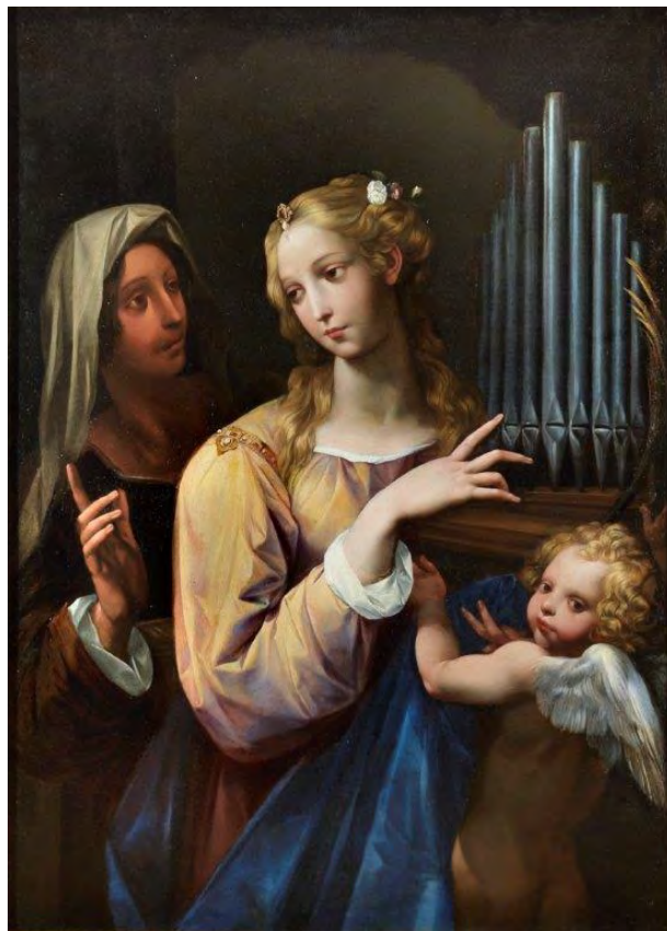
Santa Cecilia Giuseppe Cesari, detto il Cavalier d'Arpino