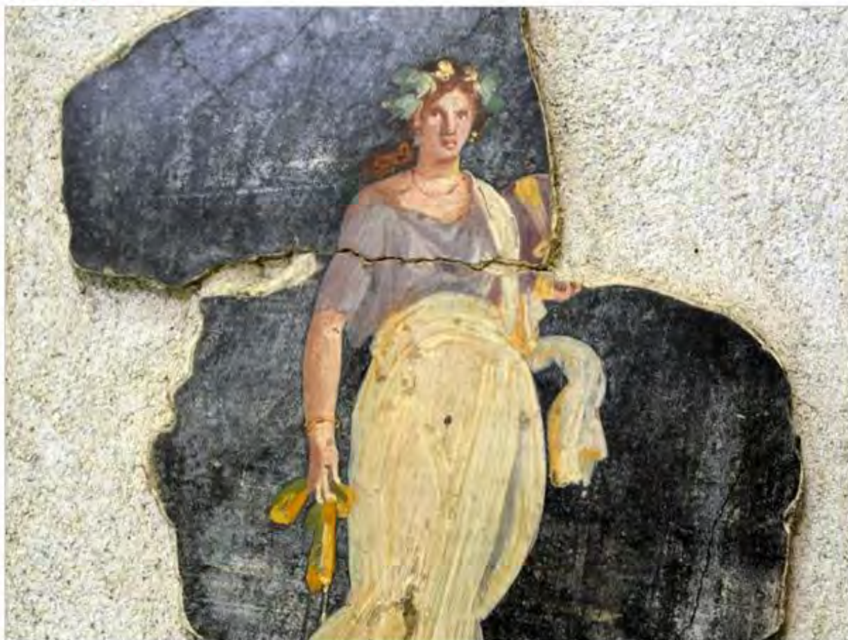
Frammento di affresco con figura femminile coronata d'edera dalle Terme Suburbane di Pompei (I sec. d.C.)