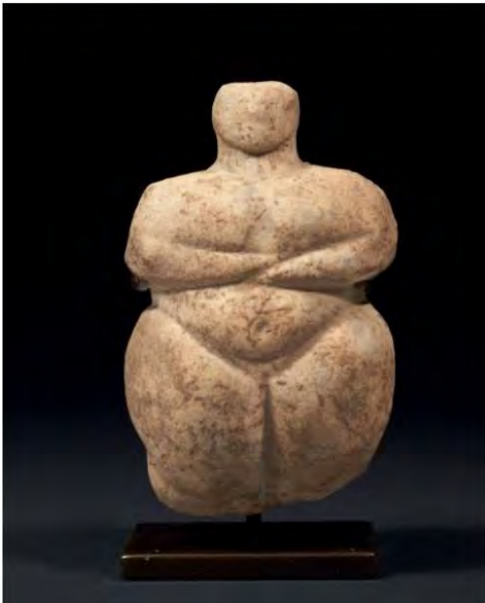
Roma, 10 mag 11:38 - (Agenzia Nova) - Idolo cicladico in marmo "Grande Dea Madre" (Rer)

Cultura: Sorgente group, alla mostra "Eva vs Eva" a Tivoli con il Guercino e altre due opere di pittura e archeologia - foto 2