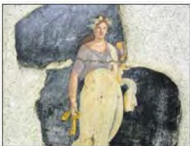
Frammento di affresco con figura femminile coronata d'edera dalle Terme Suburbane di Pompei (I sec. d.C.)

Il palazzo, la Villa d'Este di Tivoli, è stupefacente e mozzafiato (non solo per D'Annunzio). Un luogo di grande frequenza turistica: 700 mila visitatori ogni anno. Essa ospita ora una mostra singolare e originale: «Eva vs Eva: il duplice volto della donna nell'immaginario occidentale», allestita nel piano nobile e nell'adiacente Santuario di Ercole vincitore (sino all'1 novembre; ore 8.30-19.45).