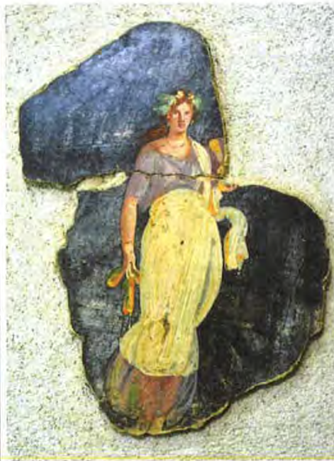
Sopra, frammento di affresco dalle Terme Suburbane di Pompei; a sinistra, "Giuditta e Oloferne" di Giovanni Battista Piazzetta; in basso, a sinistra, ritratto velato raffigurante Vibia Sabina e a destra, frammento di sarcofago col mito di Giasone e Medea.