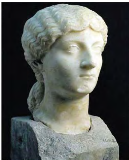
In alto, frammento di sarcofago con il mito di Giasone e Medea