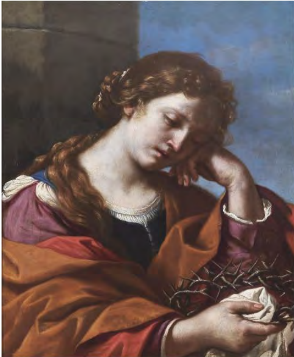
Roma, 10 mag 11:40 - (Agenzia Nova) - "Maria Maddalena che medita sulla Corona di spine" del Guercino (Rer)

Cultura: Sorgente group, alla mostra "Eva vs Eva" a Tivoli con il Guercino e altre due opere di pittura e archeologia - foto 3